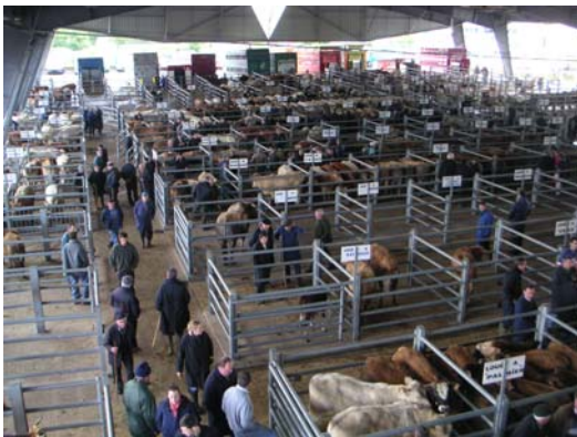
Seguridad para personas y animales