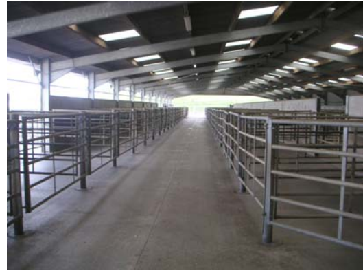
Facilidad para el manejo