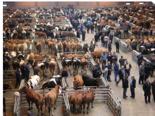
Seguridad para personas y animales