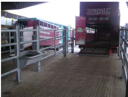
Facilidad y seguridad en cargas y descargas