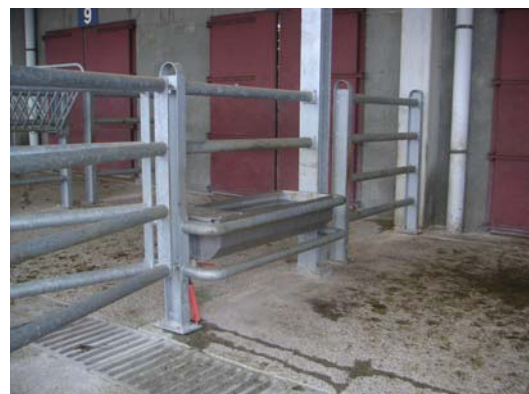
Dotaciones para los animales