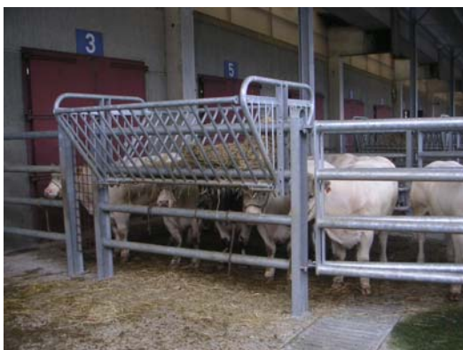
Dotaciones para los animales