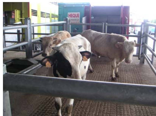
Seguridad y tranquilidad en el manejo.